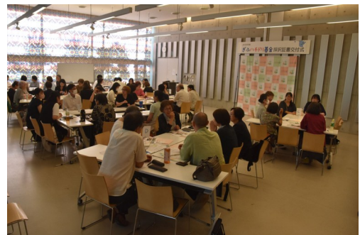
採択証書交付式の様子