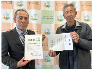
12/21 岐阜県職員互助会様より