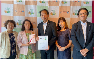
8/10 大垣キワニスクラブ様より